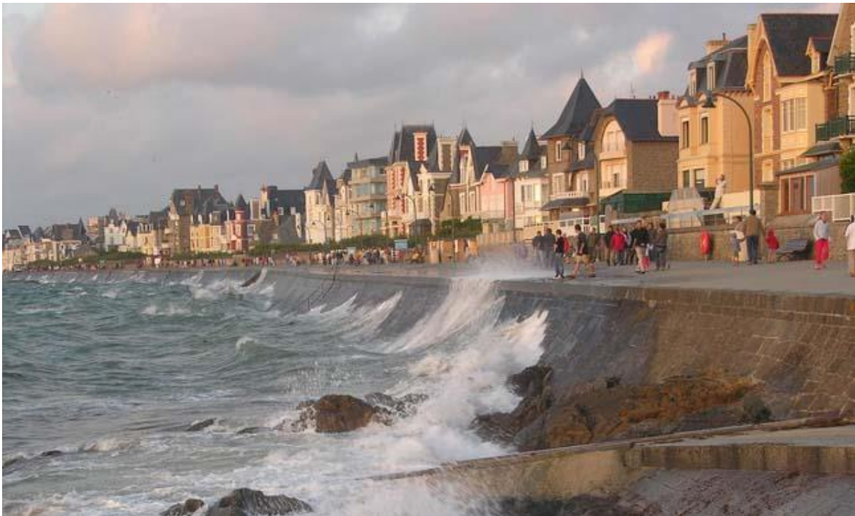
Szállás Guingampban. Garden Center látogatás

A Saint-Malo öböl az egyik legnagyobb árapály-különbséggel rendelkező tengerpart (akár 12m is lehet!) Európában.